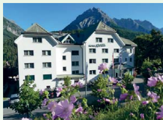
Hotel Altana*** 7550 Scuol www.altana.ch Tel. +41 (0)81 861 11 11

Verpflegung: Bei allen Gastgebern entlang der Via Engiadina können Wanderer regionale Gerichte und klassische Engadiner Spezialitäten genießen. Zudem sind in jedem der Partnerhotels Lunchpakete erhältlich, so dass Sie sich auf den Etappen keine Sorgen über die Verpflegung unterwegs machen müssen.