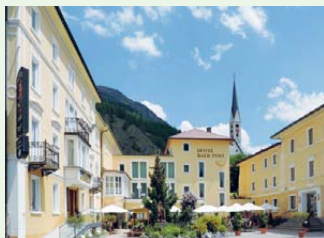
Hotel Baer & Post***Superior 7530 Zernez www.baer-post.ch Tel. +41 (0)81 851 55 00