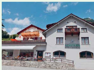
Schorta's Alvetern*** 7546 Ardez www.alvetern.ch Tel. +41 (0)81 862 21 44