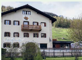
Hotel Piz Buin*** 7545 Guarda www.pizbuin.ch Tel. +41 (0)81 860 30 40